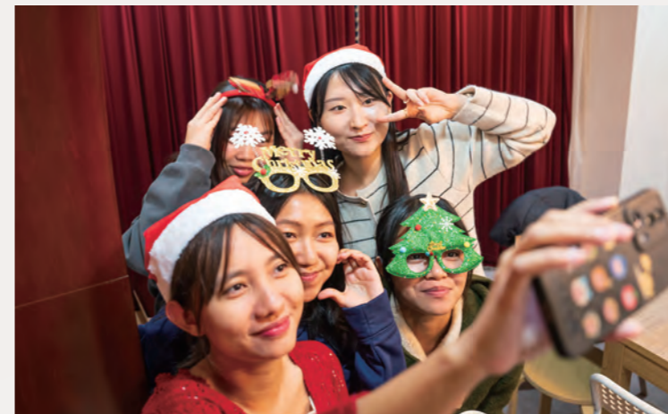
クリスマスパーティー