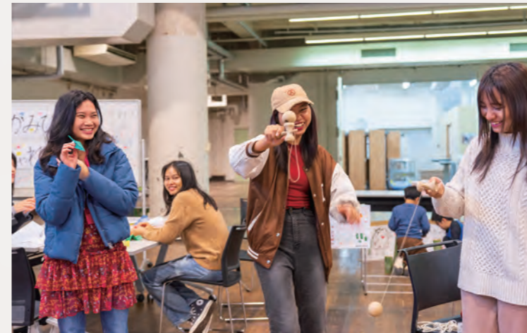
まなびと10周年イベント

やがて「掃除だけじゃおもしろくない」という声から、入居者同士のコミュニケーションやルールづくりも行う「ホームルーム」へと発展。住環境を自分たちで整える意識が育ち、自治力も育っています。