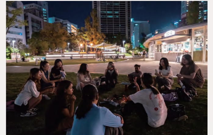
ナイトピクニック