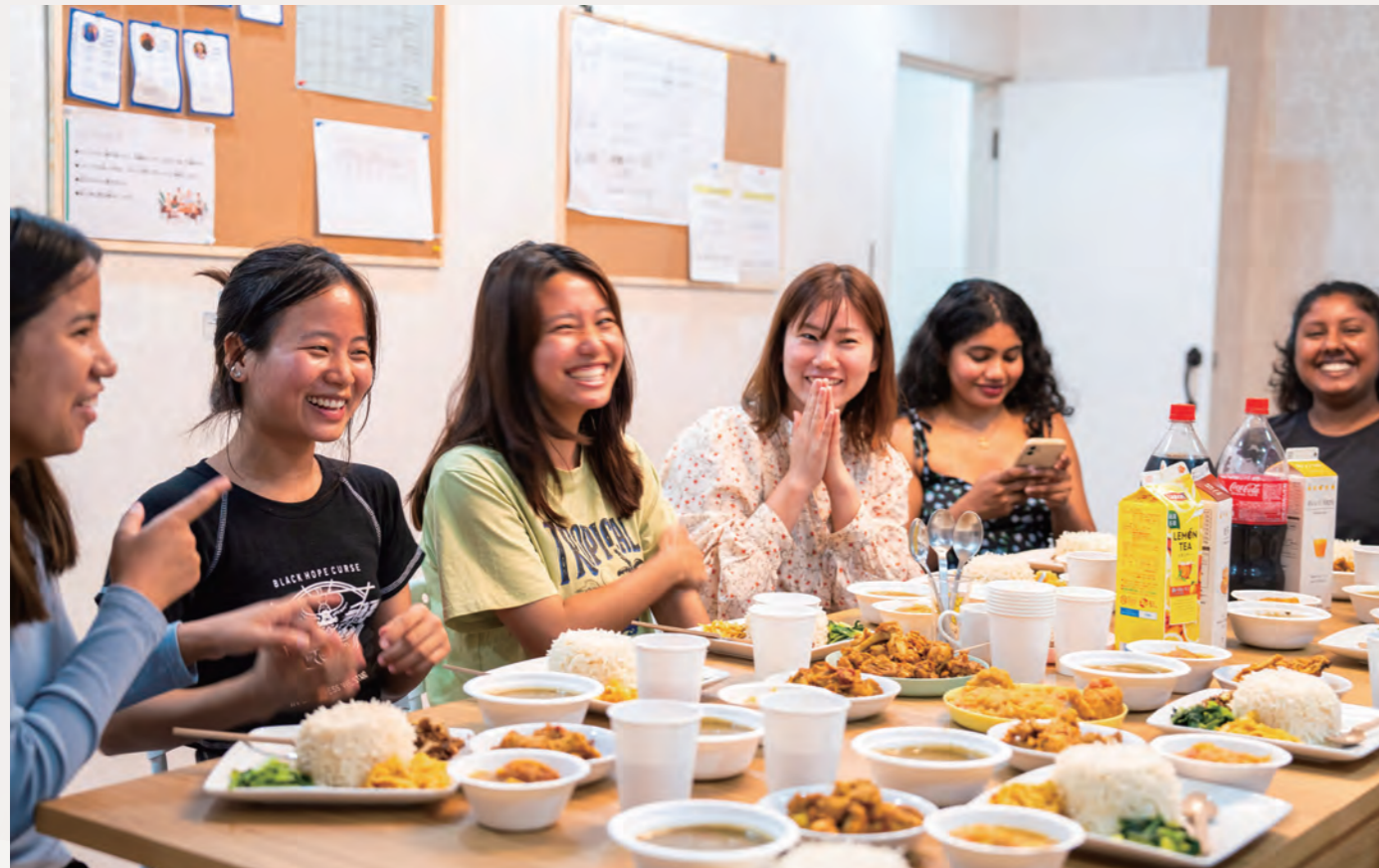
ネパールカレー交流会