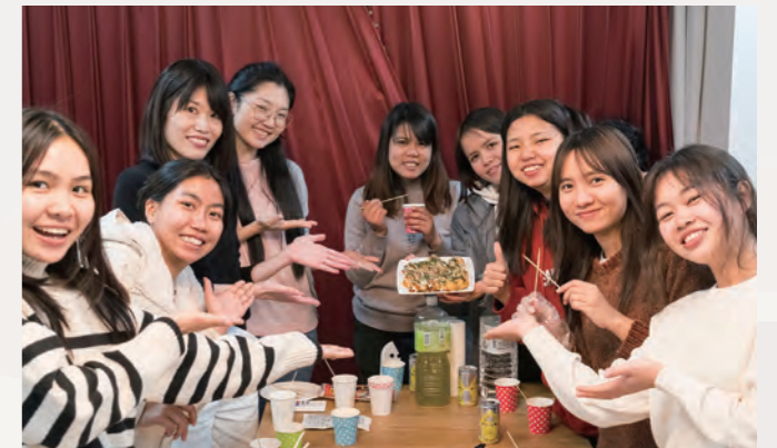
たこ焼きパーティー