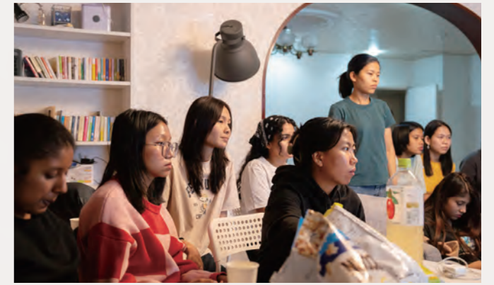
シェアハウスのホームルーム