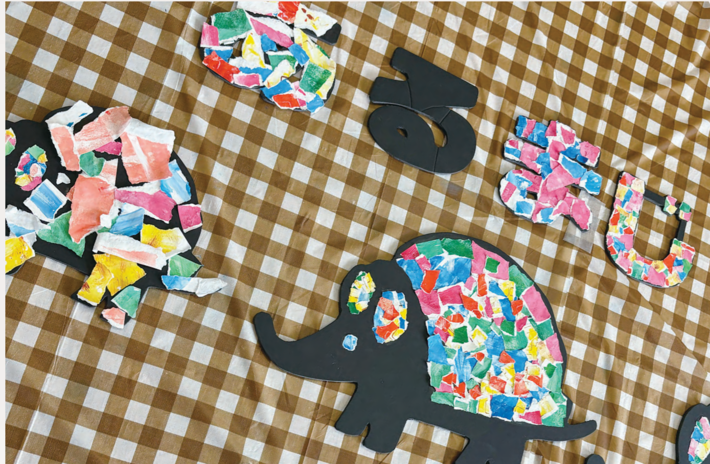
親子会であるまじろの看板作り