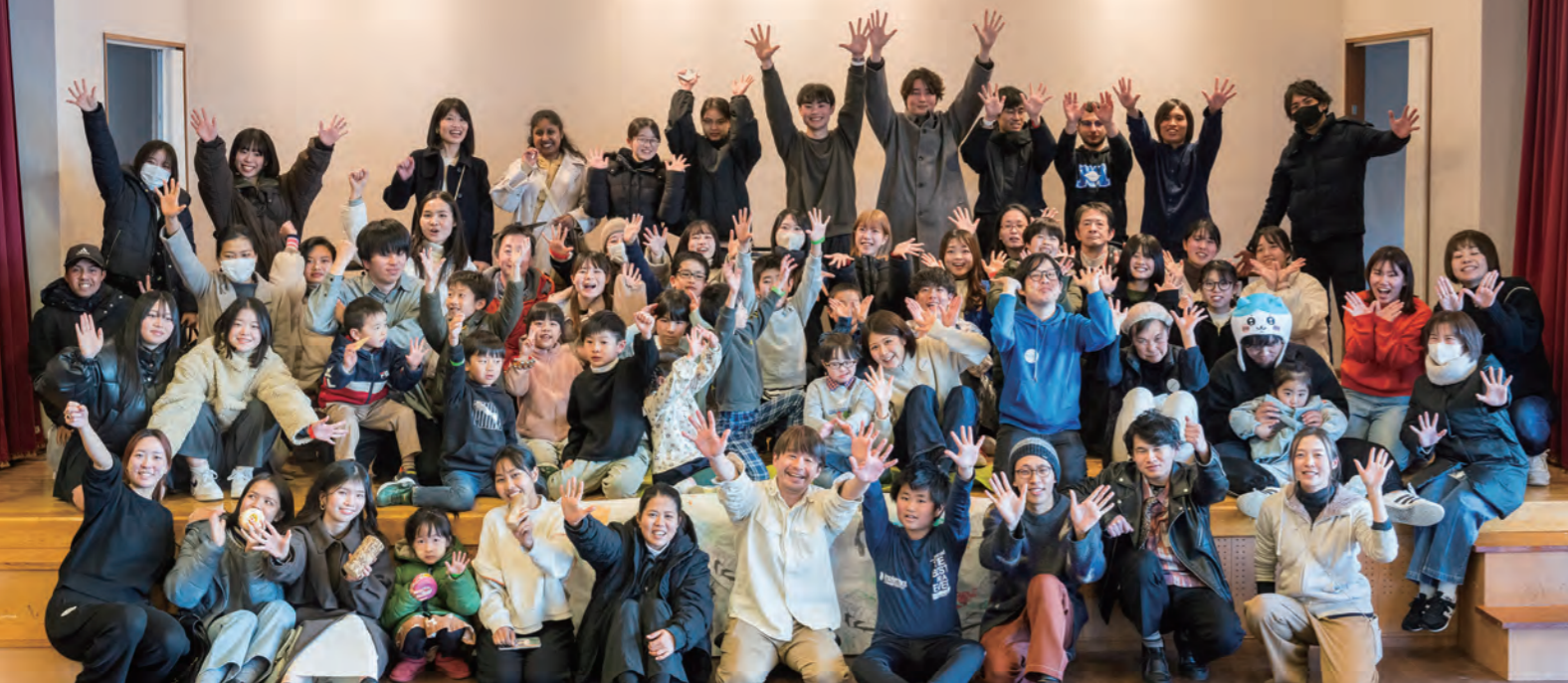
今年もたくさんの方が参加してくれました