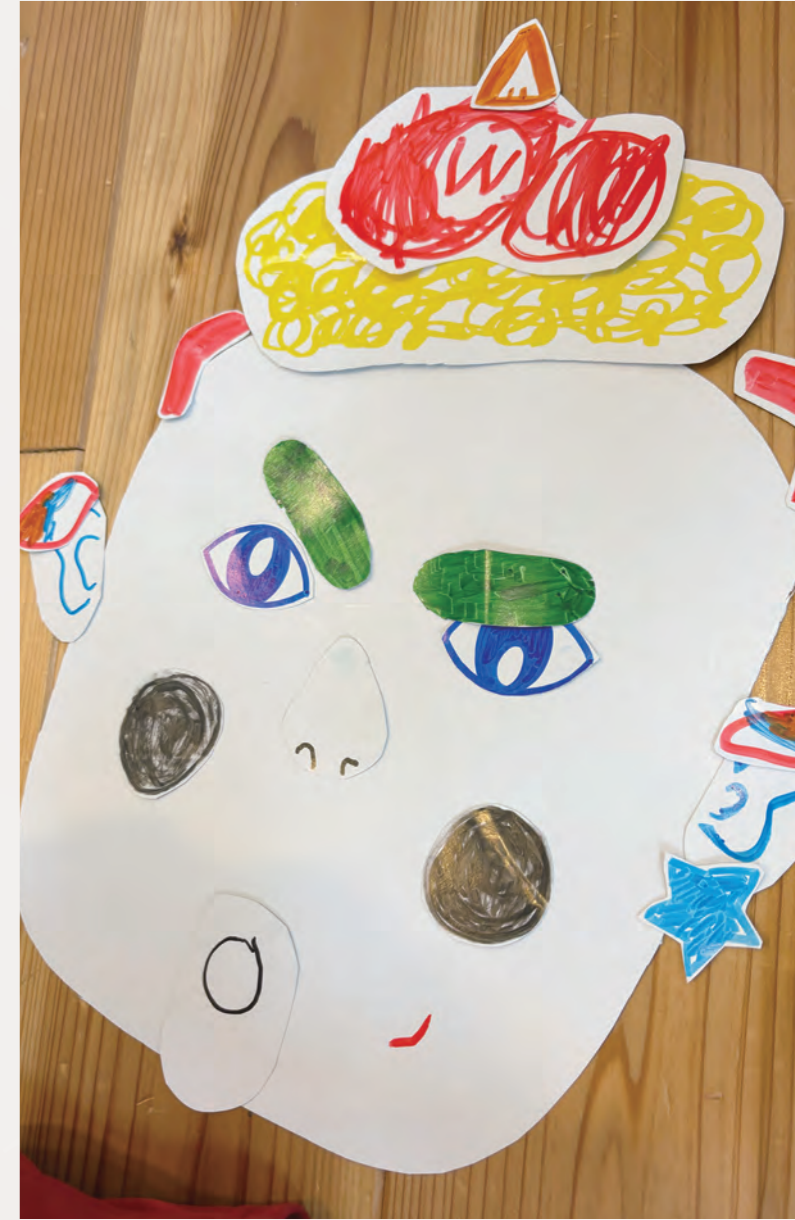
福笑いイベントでお面を作りました

形式ばらない座談会や親子会を開いたことで、保護者や相談支援専門員が気軽に顔を出し、新しい利用相談にもつながりました。スタッフは「子どもがいろいろな人と出会える場にしたい」と考え、公園で近所の子どもたちと遊んだり、そこで出会った子をイベントに誘ったりしながら輪を広げていきたいと思っています。同業者とも情報交換が始まり、自由時間をどう支えるかを語り合う機会を模索中です。2025年度は地域や保護者がもっと気軽に立ち寄れる“開かれた居場所”を育てていきます。